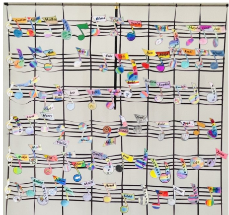
Motiv aus der Anna-Katharina-Kirche, Coesfeld

Wir freuen uns, wenn sich die feiernde Gemeinde durch unsere Musik zum Zuhören und Mitsingen anstecken lässt - und die einen oder anderen Töne vielleicht im Alltag weiterklingen.